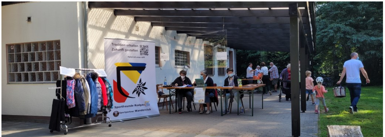
2021 Oktoberfest mit den Sportfreunden Rodgau auf dem Wanderclubgelände