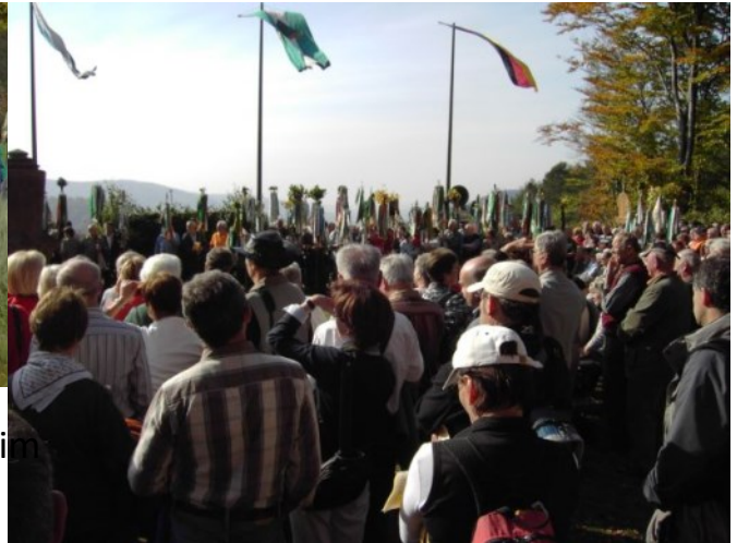
2008 Pollasch 2008 Weintour Asselheim