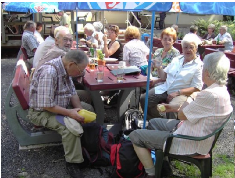
2009 Zwetschenknödel Zwetschenknödel Mus'í und die erste Pilzwanderung