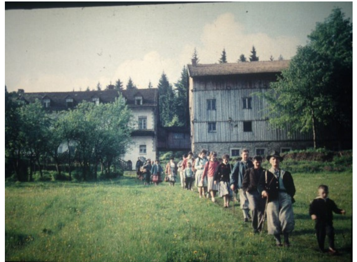
1957 Bayerischer Wald Großer Arber