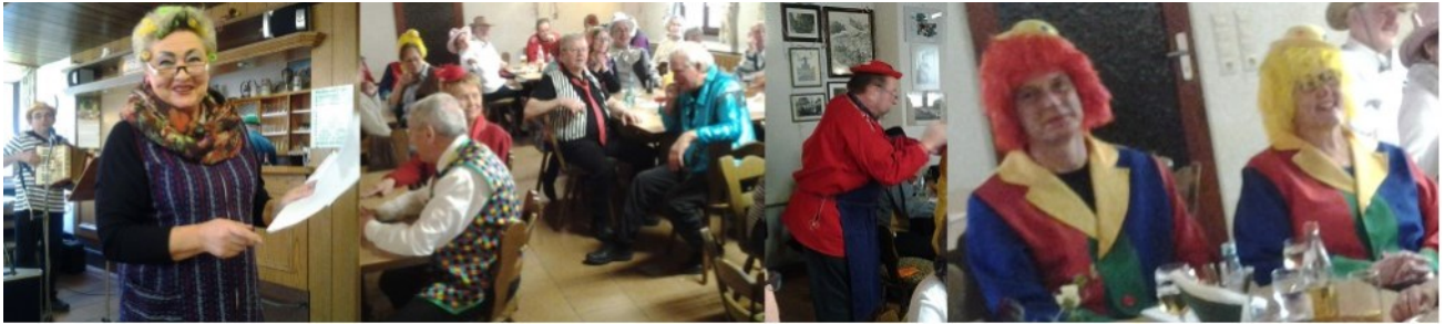
2015 Fastnacht im Wanderclubhaus

Stimmungsvolle Faschings- und Kerbsonntage und der Frühschoppen im Wanderclubhaus waren ebenfalls Tradition und brachten viel Geselligkeit in die Wanderer-Herzen.