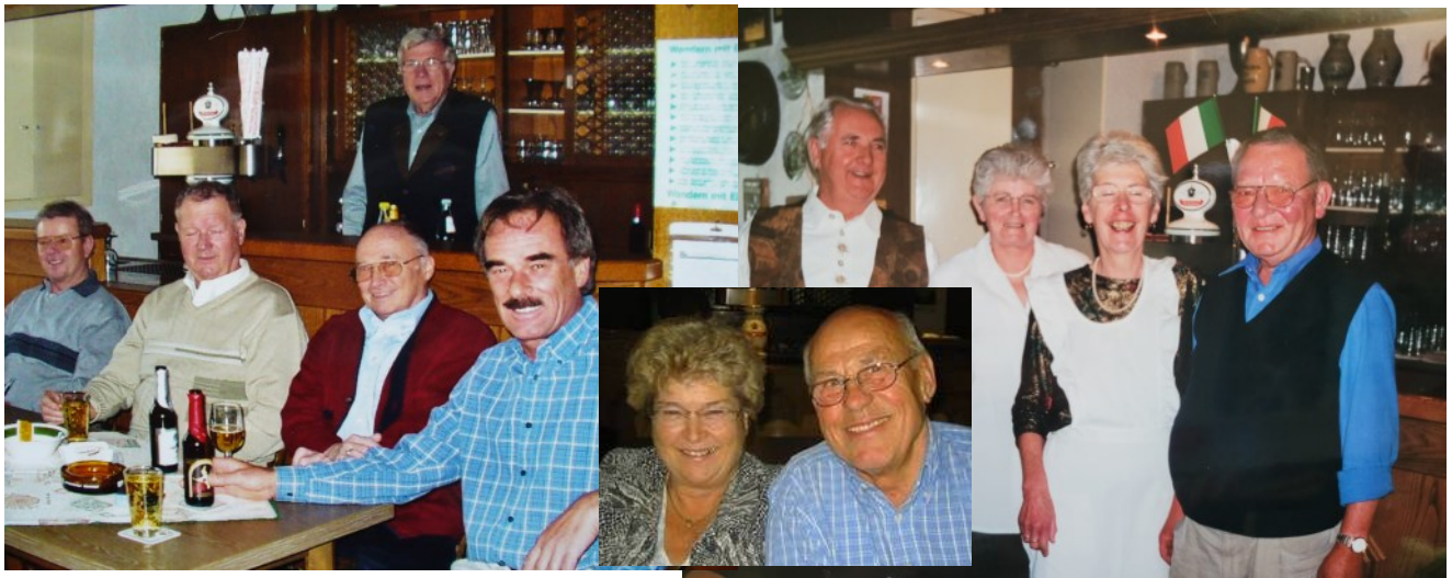
2004 Pollaschfeier des Spessartbundes

Die beiden unteren Bilder stehen stellvertretend für alle Helfer rund um die Bewirtung und Betreuung im Vereinshaus für Sonntagnachmittage, Fröhschoppendienste, Schlachtfeste, Wanderjugend Übernachtungen und mehr.